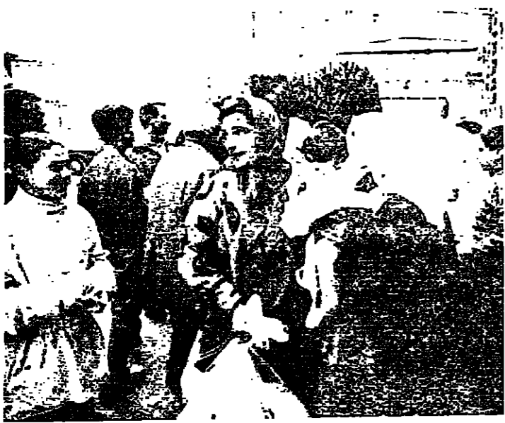
المساعدات في عشنة بكار